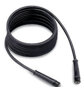
出水高壓管.10/mt. TBAP 25324