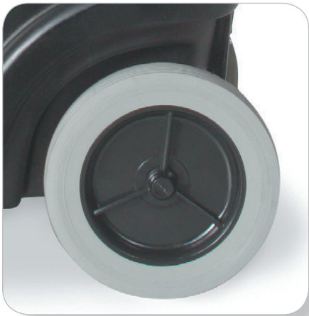
白色材質膠胎不污染地毯