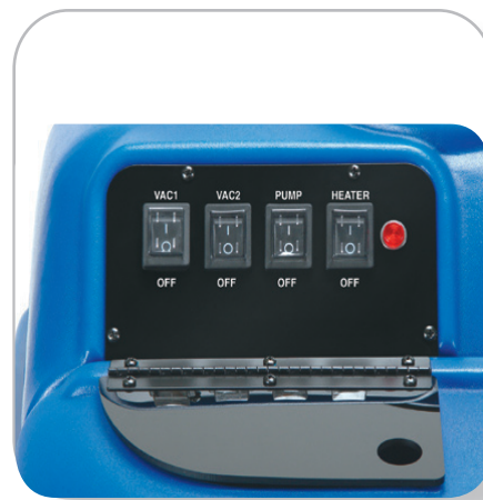
獨立式操作開關操作更方便