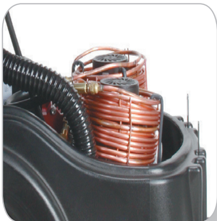
世界專利 " 環保高效能加溫 " 利用吸水 馬達運轉產生熱能加溫不需再消耗電力