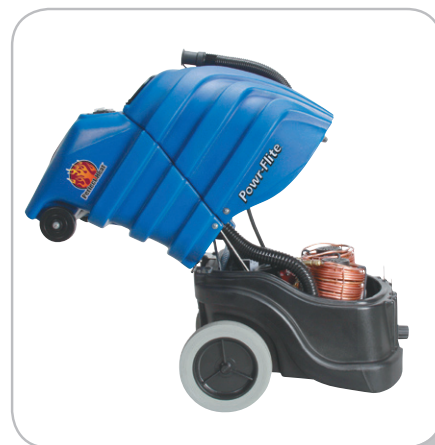
掀背式機體設計 檢視,保養,維修更輕鬆