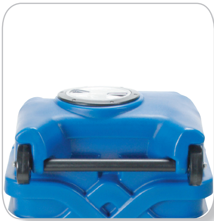
內建移動握把配備移動輪 運輸上下車更方便更輕鬆